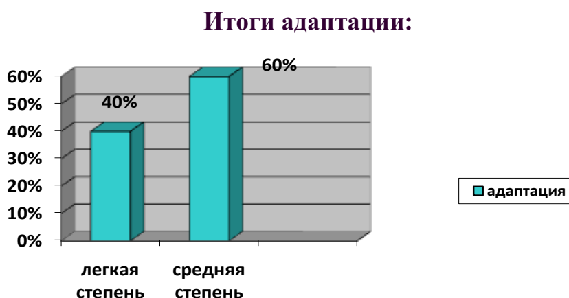
Рисунок № 2

Вывод: Как видно из диаграммы в 2021-2022 учебном году адаптация к детскому саду у детей прошла в легкой и средней степени, отсутствуют случаи тяжелой степени адаптации.