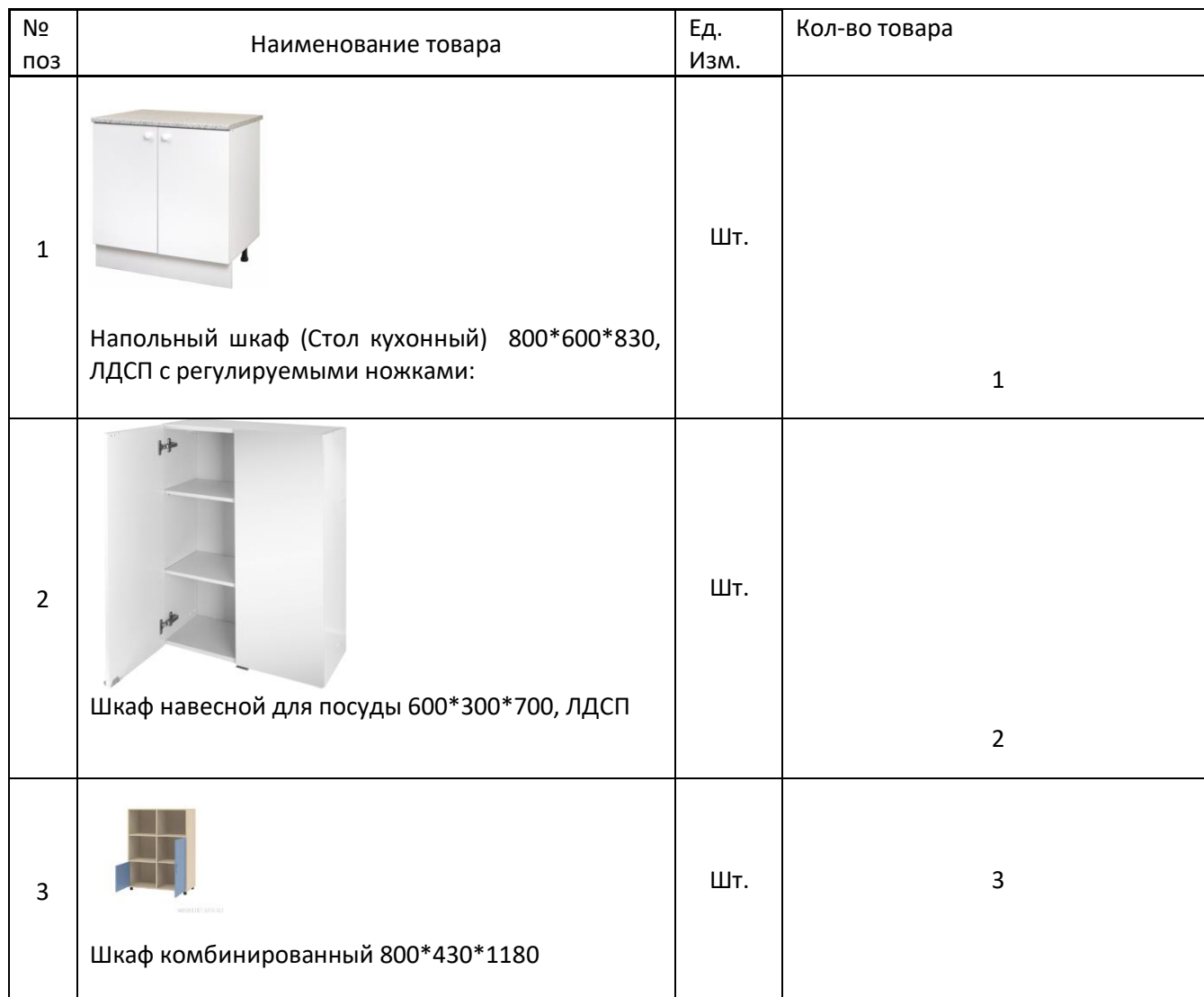
Таблица № 7

Т. о материально-техническая база в 2021-2022 учебном году пополнилась.